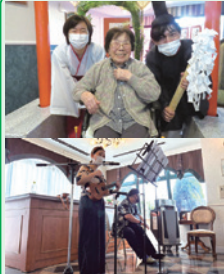
記者: 北村 美果

2023年6月26日(月)27日(火)の2日間、北緑丘コミュニティの6月イベントとして「夏越の祓」を開催いたしました。 午前中は、各フロアに鳥居と茅の輪を設置し、一緒に唱え言葉を読みながら、お一人ずつ茅の輪くぐりを行い、残りの半年の無病息災を祈願しました。 「懐かしい感じがする!」「何回くぐるの?」と、茅の輪を各々の想いでくぐっていました。 午後からのエンタメでは、ウクレレとカホンの演奏をお聴きいただきました。 楽器を実際に触っていた皆さま、「初めて見る楽器!」「どんな音が出るの?」と、とても興味津々の様子で、演奏中は一緒に歌ったり、身体を動かしたりしながら楽しんでいただきました。