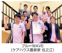
ブルーWAVE (ケアハウス豊泉家 住之江)

2022年度はフェローの離職やコロナ対応により苦戦に立たされた中で、チームが協力しあわせて運営を行い、MPを達成したことが高く評価されました。2023年度は新たなフェローも加わり、改めてチーム一丸となり、コミニティを引っ張っていく存在になってもらいたいとの期待を込めての受賞となりました。 ※MPはその年度の目標のことをマスタープランといいます。