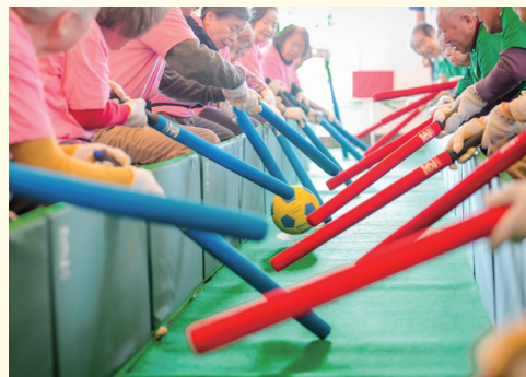
■365日愉しめるアクティビティやイベント