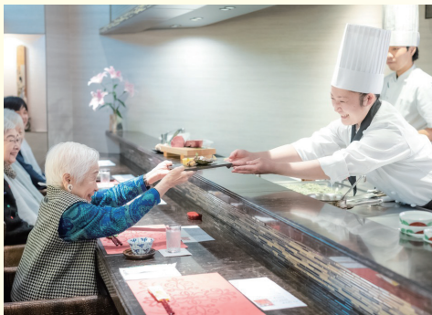
■和・洋・中 選べる6つのレストランとメニュー