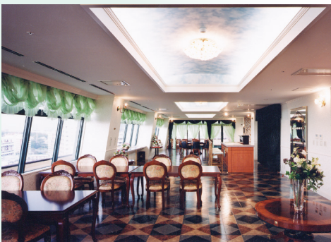
■ ご家族で愉しめる展望レストラン