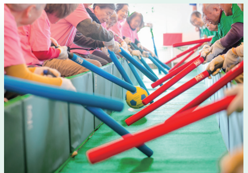
■ 365日愉しめるアクティビティやイベント