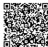
大阪府新型コロナ 受診相談センター (大阪府民対象)