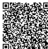
「自費検査を提供する 検査機関一覧」

詳細は厚生労働省ホームページ「自費検査を提供する検査機関一覧」をご確認ください。